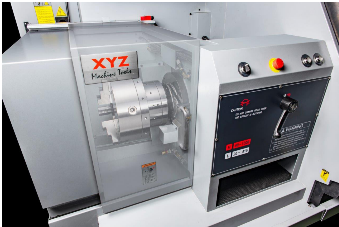
Stützfutter auf Spindelrückseite